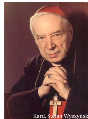
Kard. Stefan Wyszyński

dowolnego kształtowania polityki personalnej we wszystkich szczeblach hierarchii (od wikarego aż po arcybiskupa). Dla szukającego z komunistami kompromisu ówczesnego kardynała Stefana Wyszyńskiego dekret ten pozostawał poza granicami dopuszczalnych ustępstw. Postawa ta stała się powodem aresztowania kardynała, a następnie do jego uwięzienia. 24 września 1953 r. władze przyjęły specjalną uchwałę zakazującą kardynałowi przebywania w Warszawie oraz pełnienia wszelkich funkcji na stanowiskach kościelnych. Po aresztowaniu kardynał Wyszyński przebywał kolejno w Rywałdzie, następnie blisko rok w Stoczku Warmińskim, rok w Prudniku Śląskim, a od października 1955 r. do października 1956 r. w klasztorze Sióstr Nazaretanek w Komańczy. Przez większość okresu internowania towarzyszyli mu zakonnica i ksiądz, którzy okazali się agentami UB, sporządzającymi szczegółowe sprawozdania na temat zachowań kardynała. Mimo wielu szykan ze strony komunistycznych władz w tym najbardziej represyjnym okresie PRL – u, najważniejszy cel komunistów jakim było osłabienie zaufania wiernych do Kościoła nie został jednak osiągnięty.