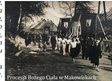
Procesja Bożego Ciała w Makowiskach

W dawnej Polsce procesja organizowana w Boże Ciało miała polityczne akcenty. Przejawiało się to nie tylko poprzez zakładanie narodowych strojów, niesienie polskiej flagi i godła. Po bitwie nad Połonką i Cudnowem w 1661 roku kroczący w procesji hetmani prowadzili więźniów i zdobyte sztandary. W okresie zaborów religijna uroczystość stawała się pretekstem do narodowego marszu. Podobnie zresztą działo się w okresie PRL-u, kiedy to każdorazowo trzeba było starać się o zgodę na procesyjny przemarsz.