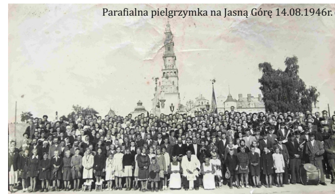
Parafialna pielgrzymka na Jasną Górę 14.08.1946r.

Centralne uroczystości odbyły się na Jasnej Górze w obecności wszystkich biskupów i przeszło milionowej rzeszy wiernych. Pusty był tylko tron prymasa, który nadal musi przebywać na wygnaniu.