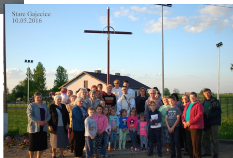
Stare Gajecice 10.05.2016

Może się komuś wydawać, że mając nowoczesne maszyny i cudowne środki nawozy oraz doskonałe środki ochrony pól i zasiewu, sam potrafi zapewnić wysokie plony. Bóg jednak ciągle w różnych znakach uświadamia nam, że od Niego ostatecznie zależy pogoda i deszcz oraz to, jakie ziemia wyda plony.