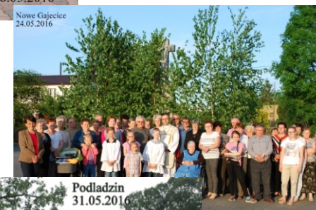
Nowe Gajecice 24.05.2016