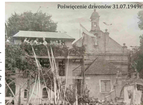
Poświęcenie dzwonów 31.07.1949r.

Dnia 31.10 zawiadomiono mnie o złośliwym uszkodzeniu nagrobka na grobie jednego z parafian. Profanacji tej dokonał ponad wszelką wątpliwość mieszkaniec tej samej miejscowości. Sprawa została przekazana prokuratorowi. Stare zapiski mówią o napadzie na plebanię, o ranach zadanych księdzu w czasie napadu, ale nie wspominają o osobistych porachunkach z nieboszczykami na cmentarzu.