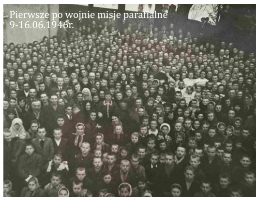
Pierwsze po wojnie misje parafialne 9-16.06.1946r.