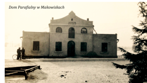
Dom Parafialny w Makowiskach