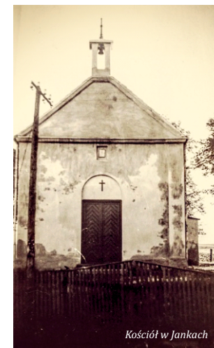
Kościół w Jankach

zatrudniony w Spółdzielni Pracy Remontowo-Budowlanej. Ogólny koszt wyniósł ok. 13000 zł. W tym też roku strażacy dokonali wyczynu nie lada. Ufundowali z własnych ofiar samochód bojowy dla Straży, który został również poświęcony na cmentarzu przykościelnym. Z władz nie było nikogo.