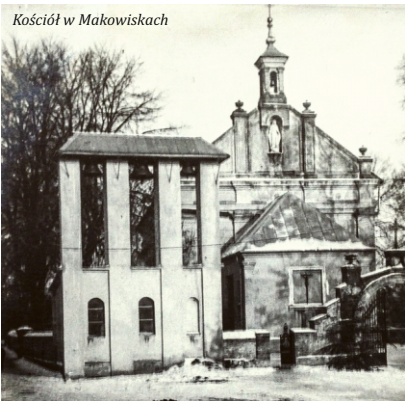
Kościół w Makowiskach