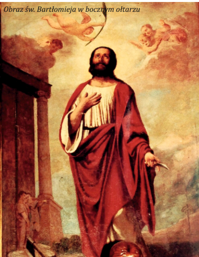
Obraz św. Bartłomieja w bocznym ołtarzu