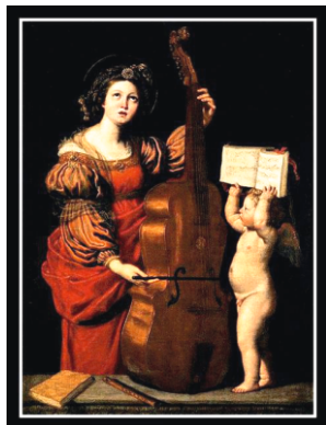
św. Cecylia - patronka muzyki i śpiewu, umęczona ok. 230 r. n.e.